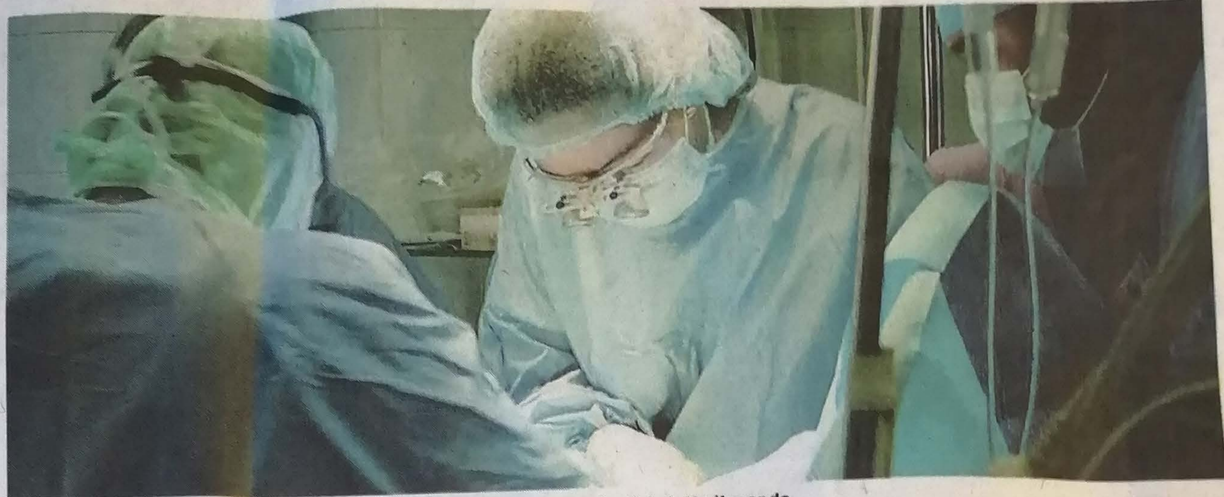
All'International Heart School vengono formati cardiocirurghi provenienti da tutto il mondo